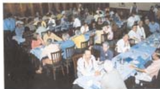
Convidados presentes no restaurante Spettus