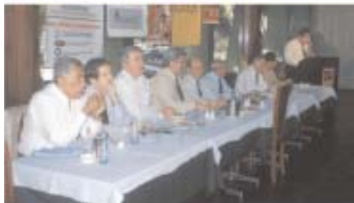
Mesa recepcionadora no almoço de homenagem